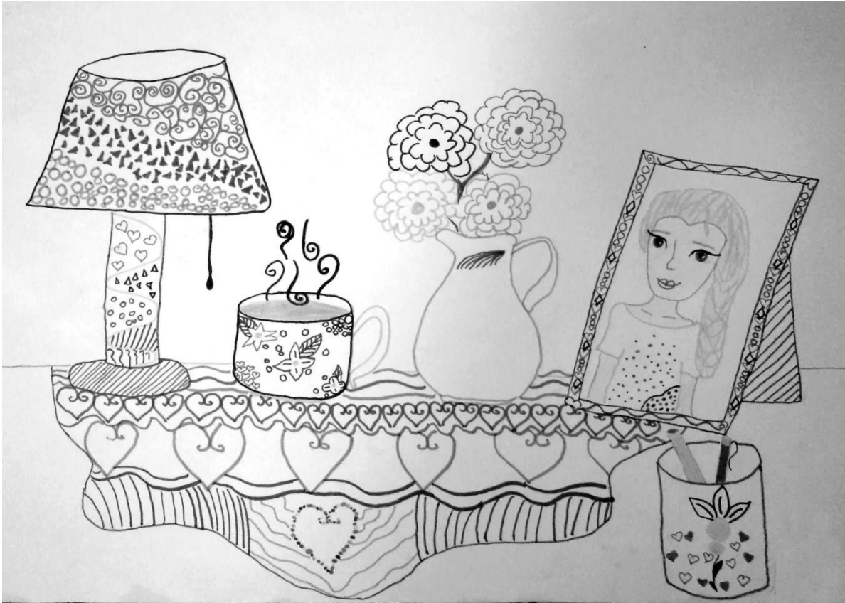
Биљана Самарџић (VII)